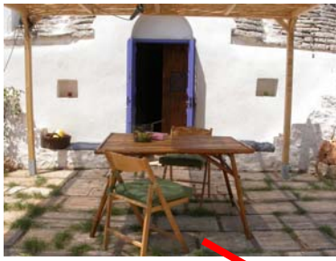
Facciata con la pergola