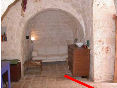
Alcova con divano