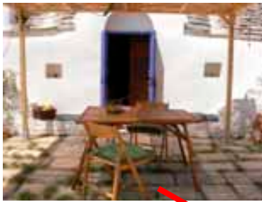
voorkant en pergola